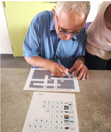
Des mots croisés imagés.

Le Département de la Gironde s'est associé à l'association ISAAC, spécialisée en communication alternative améliorée pour permettre aux personnes en situation de handicap résidant en établissements et à domicile de bénéficier de nombreux contenus culturels, de loisirs et de communication.